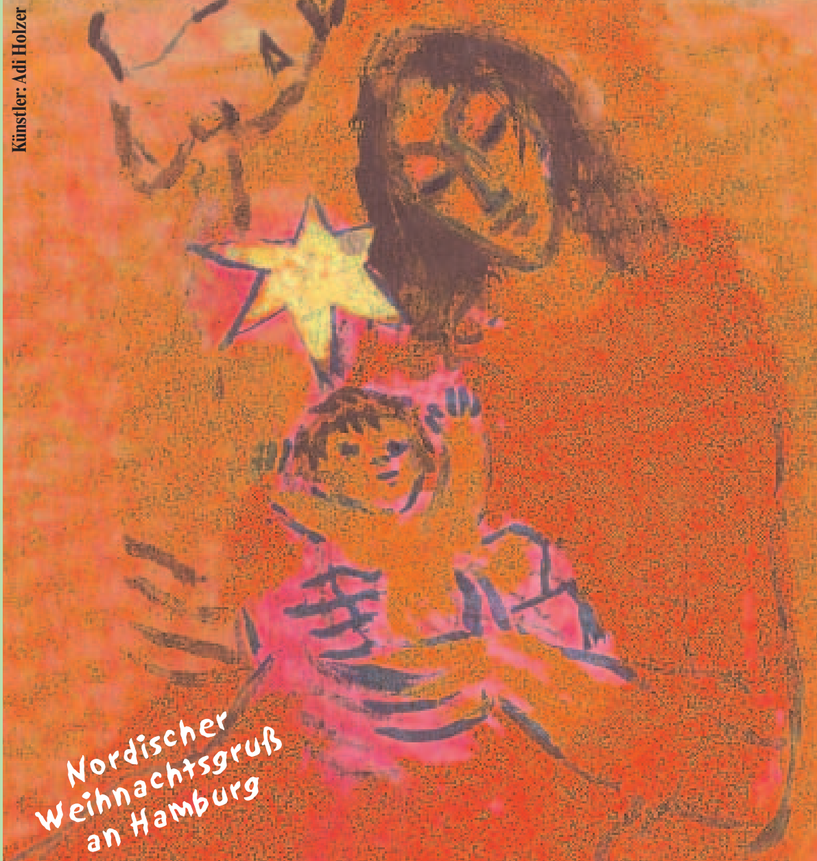
Künstler: Adi Holzer

Donnerstag, 20.11. von 17–20 Uhr Freitag, 21.11. von 12–19 Uhr Samstag, 22.11. von 12–19 Uhr Sonntag, 23.11. von 12–18 Uhr